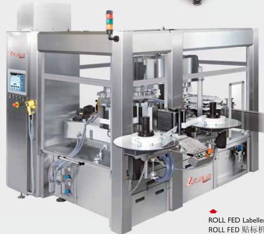
▶ ROLL FED Labeller / Этикетировщик ROLL FED ROLL FED 贴标机 / ROLL FED آلة لصق الملصقات ووضع العلامات