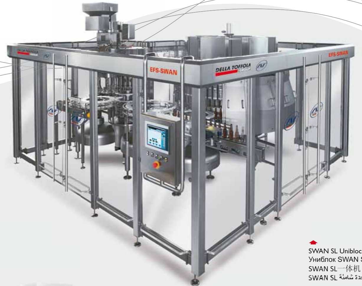
▶ SWAN SL Unibloc Униблок SWAN SL SWAN SL一体机 وحدة شاملة SWAN SL