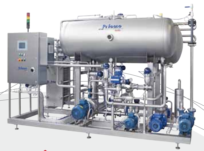
Premix / Премикс / 预混料机 / ماكينة تحضير الخلط