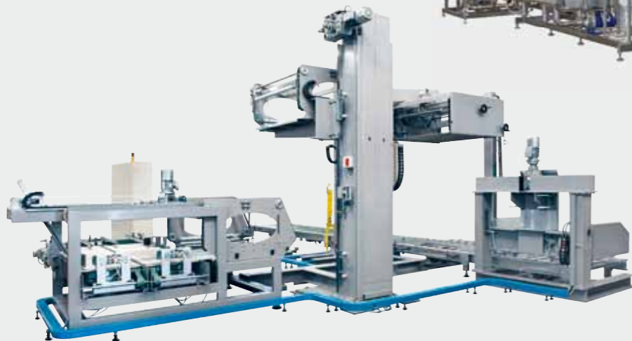
▶ Palletizer / Паллетизатор / 堆垛机 مكينة نقل وتخزين ونقل البضائع مكدسة على منصة نقالة