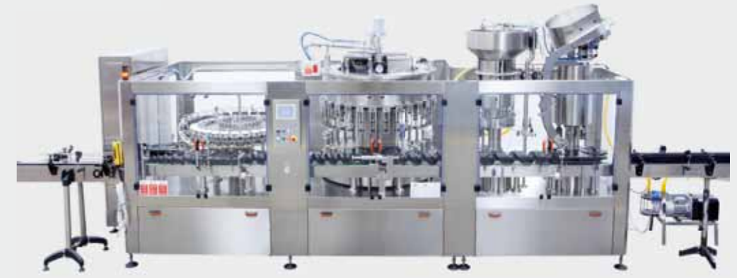
EVO-G Unibloc / Униблок EVO-G / EVO-G一体机 / EVO-G وحدة شاملة