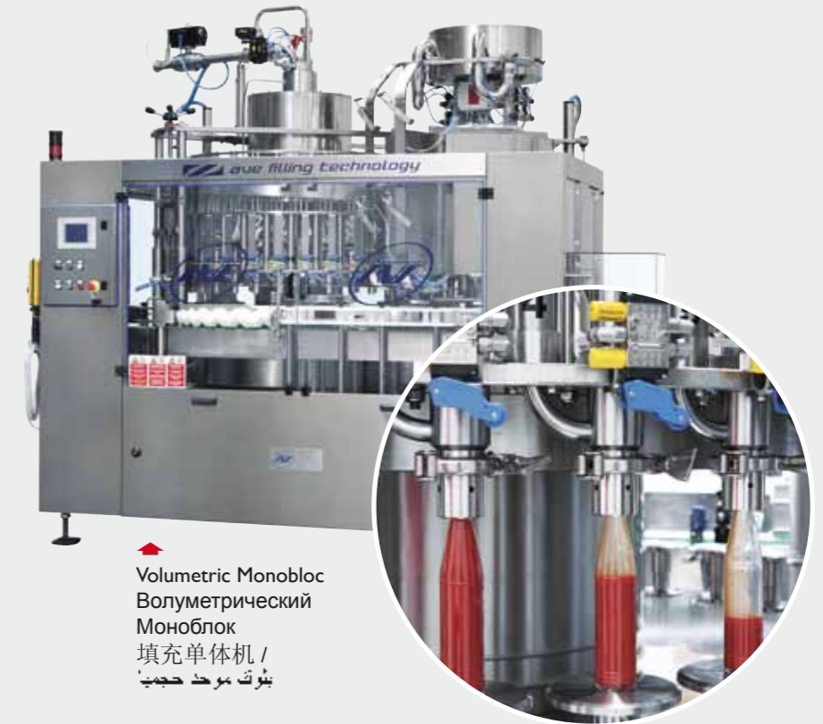
Volumetric Monobloc Волуметрический Моноблок 填充单体机 / تعبئة بوحدة حجمية