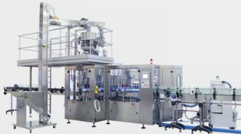
OCEANIC Unibloc / Униблок OCEANIC OCEANIC一体机 / OCEANIC وحدة شاملة