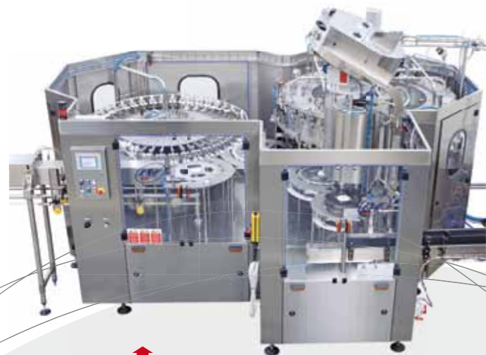
ISO NH Unibloc / Униблок ISO NH / ISO NH一体机 وحدة شاملة ISO NH