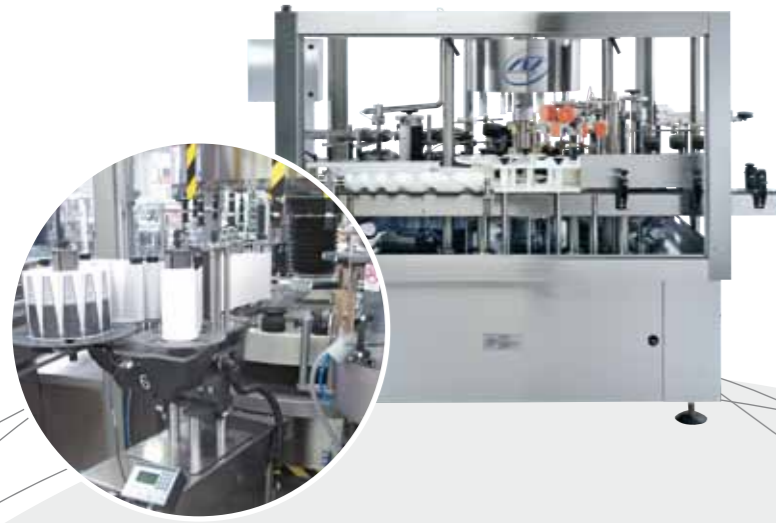
◀ Rotary Labeller / Роторный Этикетировщик / 旋转式贴标机 آلة لصق الملصقات ووضع العلامات تعمل بالدوران