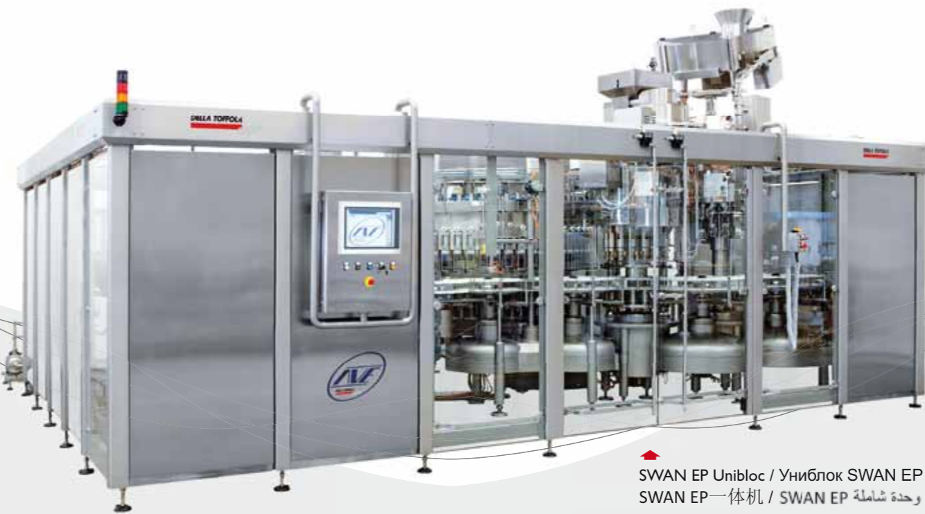
SWAN EP Unibloc / Униблок SWAN EP SWAN EP一体机 / SWAN EP وحدة شاملة