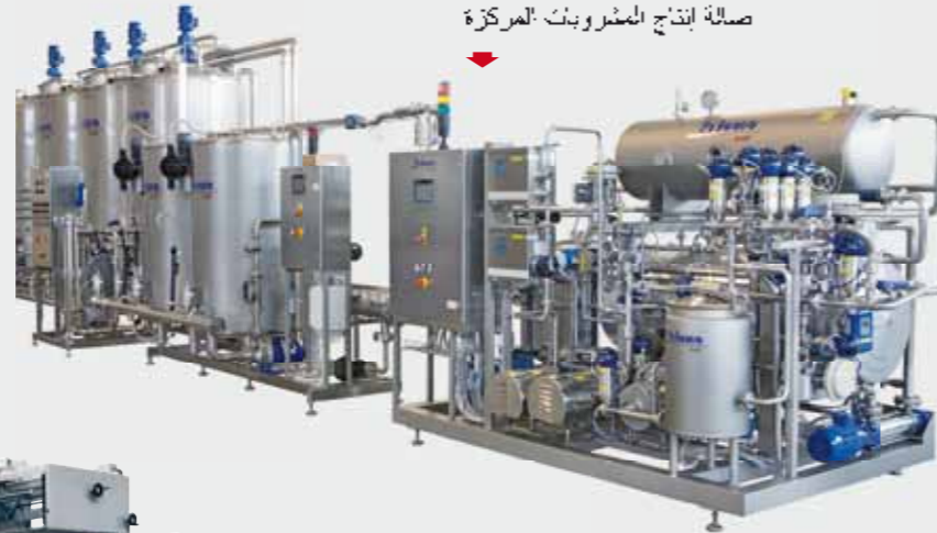
▶ Syrup room / Купажный зал / 糖浆室 صالة إنتاج المشروبات المركزة