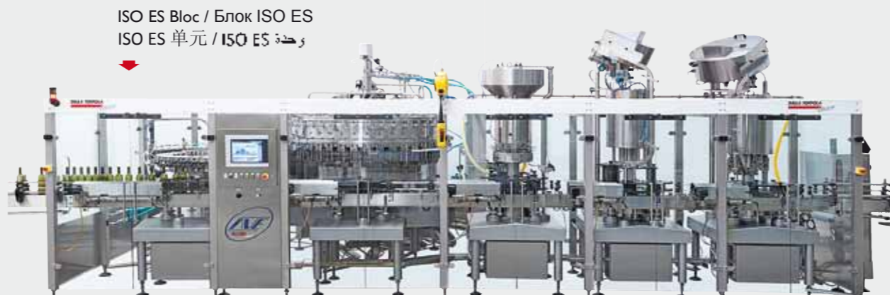
ISO ES Bloc / Блок ISO ES ISO ES 单元 / ISO ES وحدة